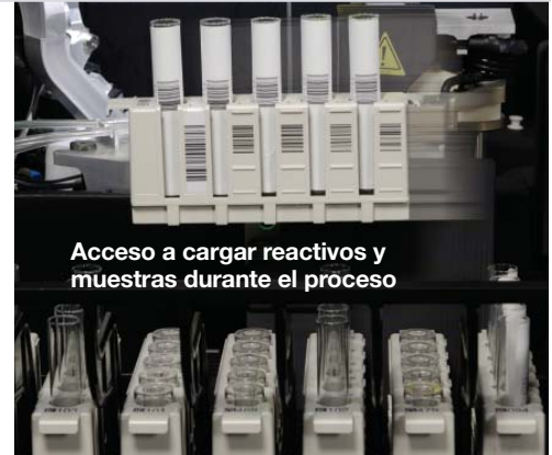
Acceso a cargar reactivos y muestras durante el proceso

ARCHITECT c4000 se puede integrar con ARCHITECT i1000SR para consolidar la química clínica y los inmunoensayos en una sola plataforma