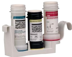
Portador de reactivos ARCHITECT i1000SR